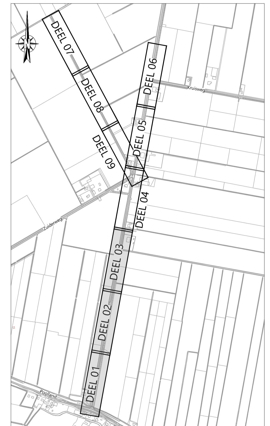
OVERZICHT Schaal n.v.t.