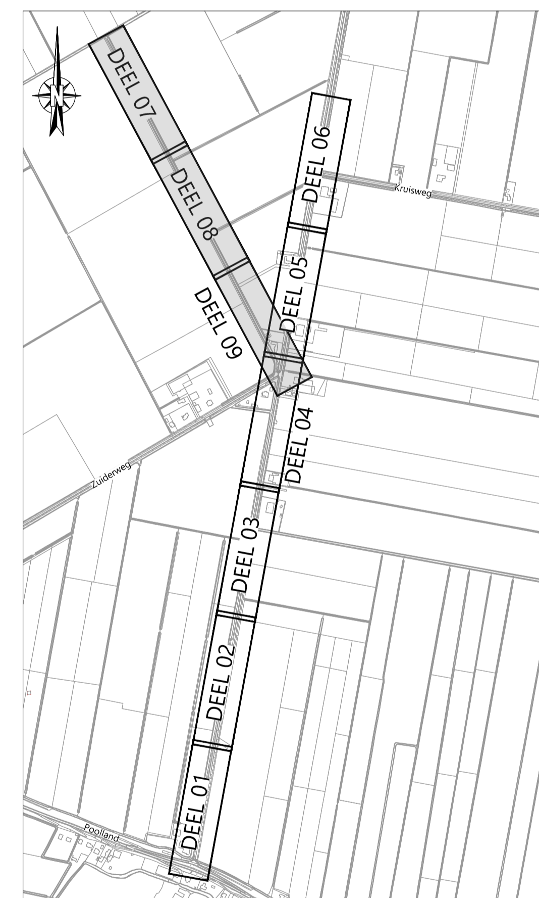
OVERZICHT Schaal n.v.t.

Opmerking: * Maatvoering in meters * Materiaalmaten in millimeters, tenzij anders aangegeven * Hoogtematen in meters t.o.v. N.A.P.