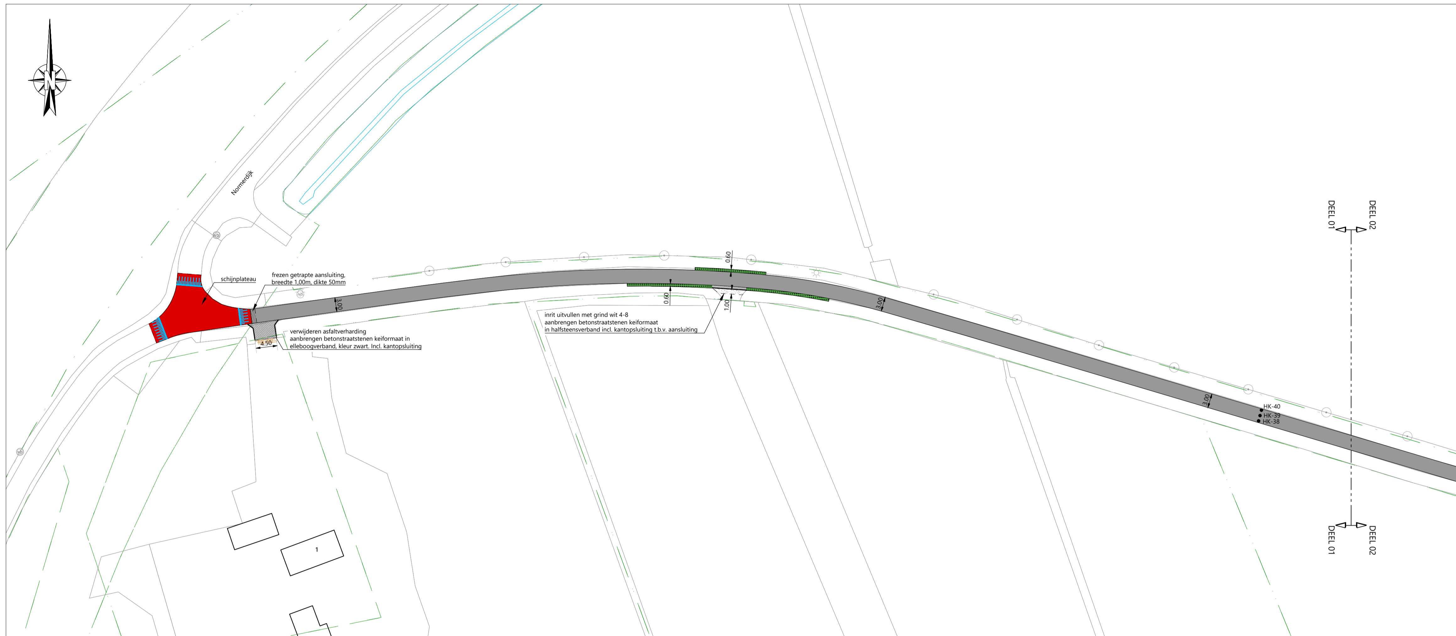
SITUATIE - DEEL 01 Schaal 1:500