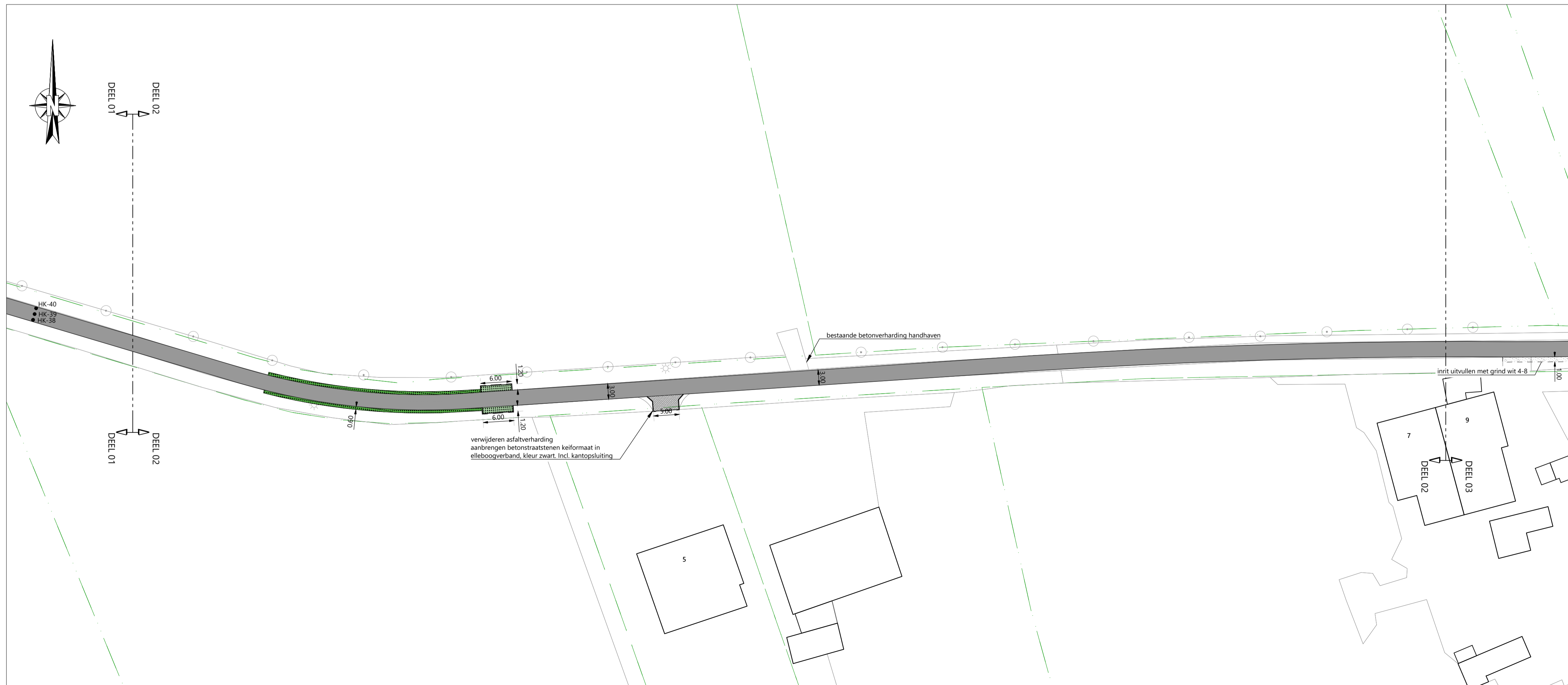
SITUATIE - DEEL 02 Schaal 1:500