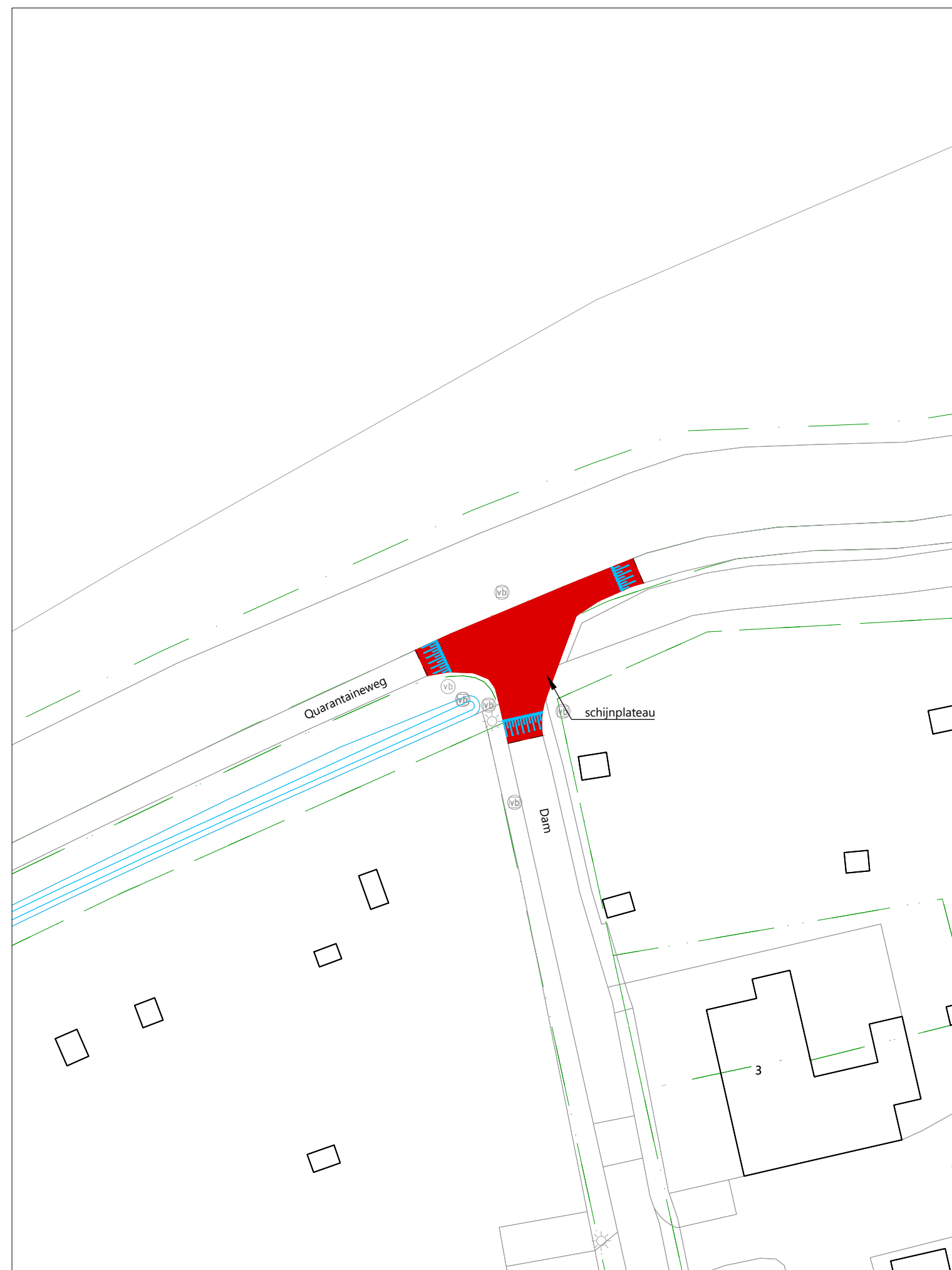
SITUATIE - KRUISSING DAM - QUARATAINEWEG Schaal 1:500