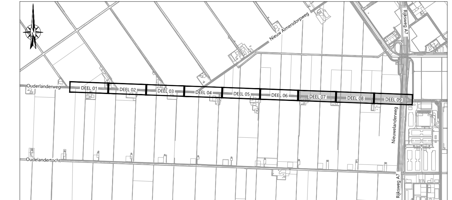
OVERZICHT Schaal n.v.t.