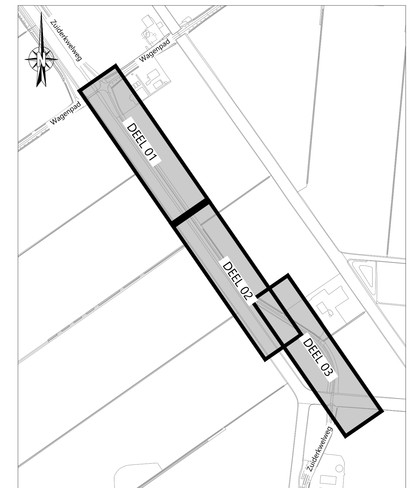
OVERZICHT Schaal n.v.t.